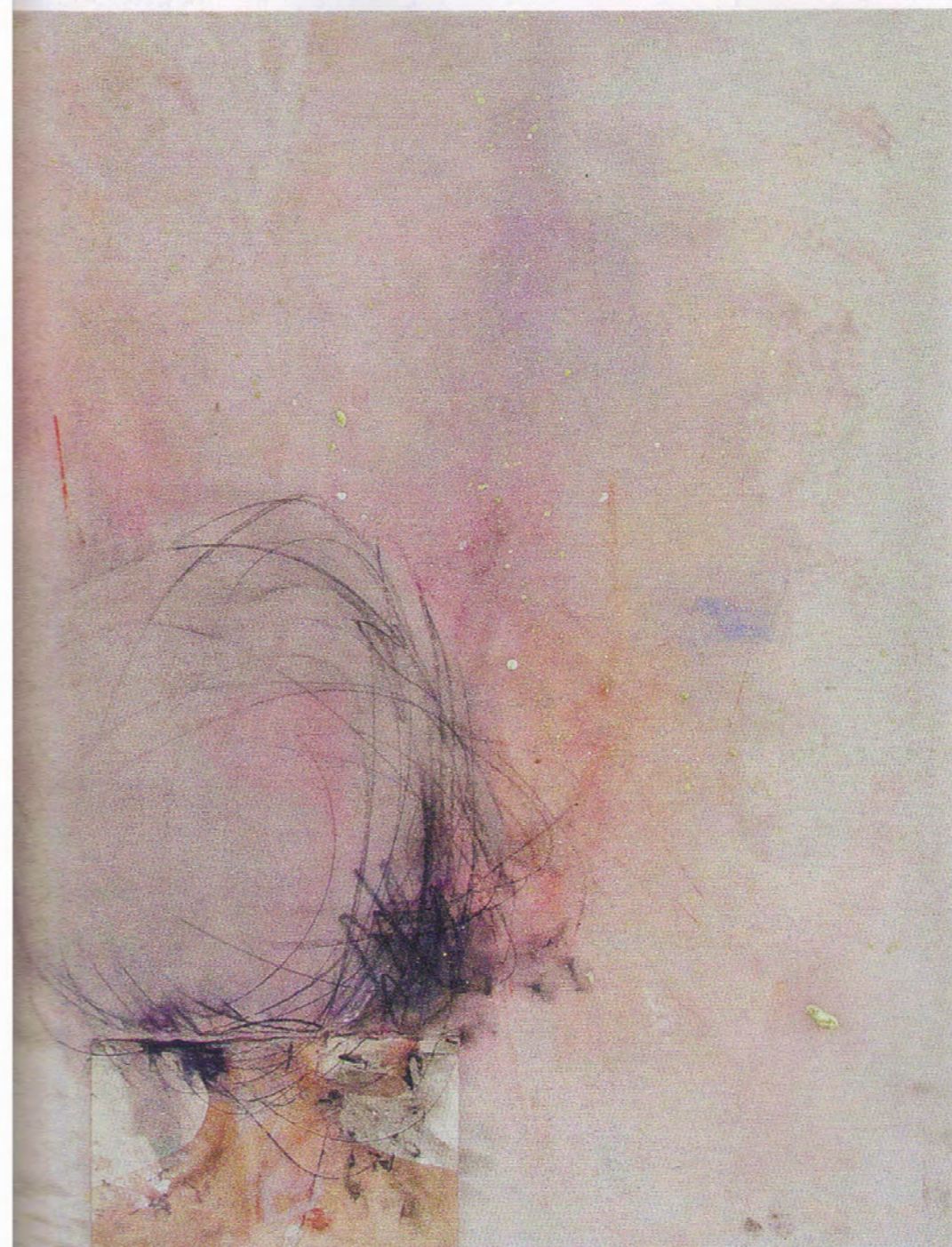
At day 2, 46 x 57 cm