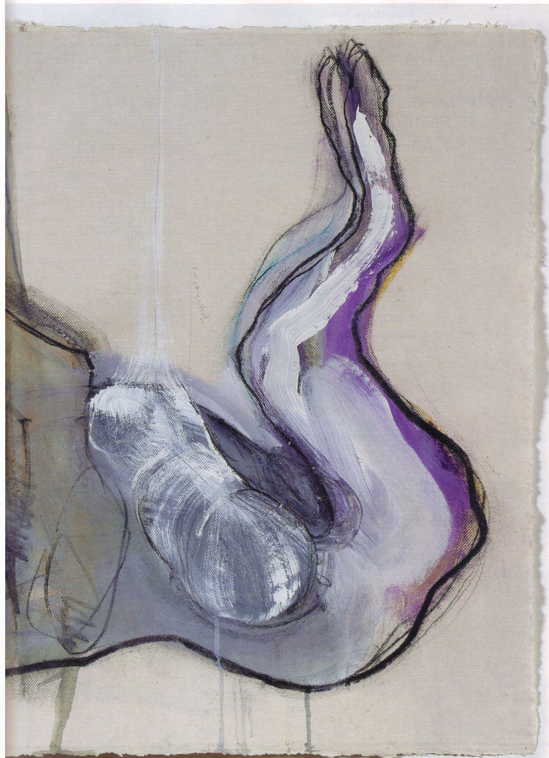
ed beuys 1, coal, pastel, acryl op papier 65 x 75 cm